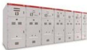
KYN61-40.5铠装移开式交流金属封闭开关柜