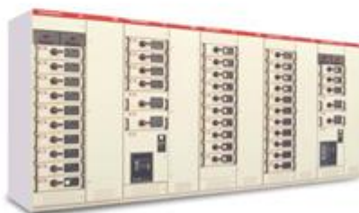
GCS低压抽出式开关柜