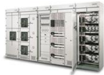
西门子授权8PT低压开关柜