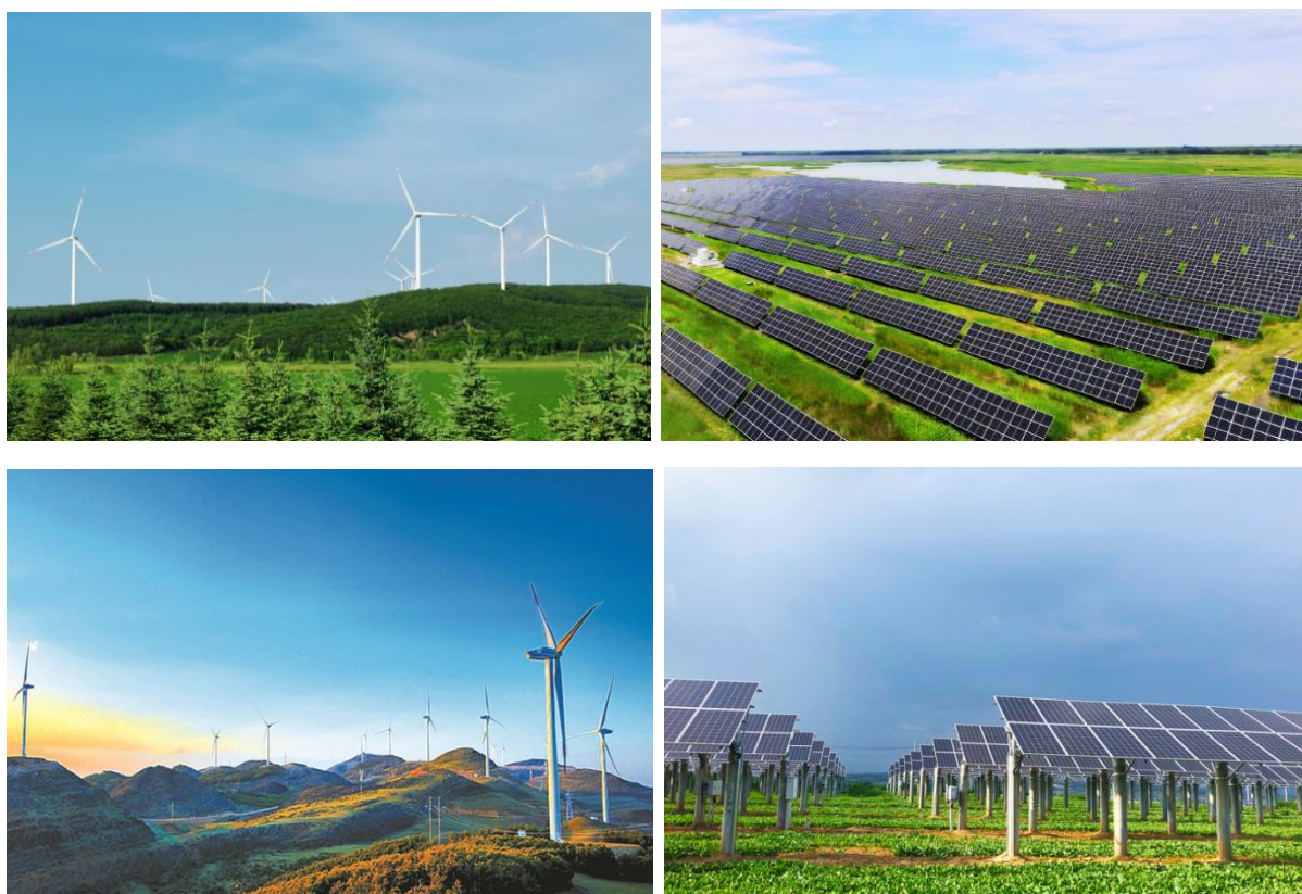
图：九洲集团自建自持风光电场

公司主要通过与国企合作共同开发、建设、持有清洁能源电站。与此同时，公司以合作共赢为导向，在新增电站资产不断投建过程中会择机择时向央国企合作伙伴出售部分清洁能源电站股权，一方面从总体控制存量资产规模，以进一步整合公司资源，优化自持清洁能源资产结构，实现“EPC价值”、“设备销售”和“风光资源溢价”等多重价值量的兑现；另一方面通过和央国企伙伴的深度合作，实现全国范围内开发资源的共享共赢。