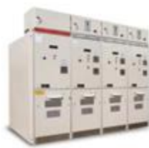
C25R-12中式固体绝缘开关环网柜