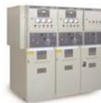
XGN15A-12小型真空开关环网柜