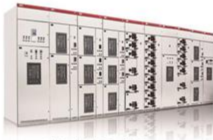
MNS低压抽出式开关柜

低压配电柜、开关柜是配电系统的重要组成部分，根据需要可以实现低压配电线路的开断、关合、分段等功能，应用广泛。公司低配电柜有多种产品，主要产品电压涵盖0.22—1.14kV电压等级。