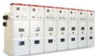
KYN28A-12铠装中置式金属封闭开关柜