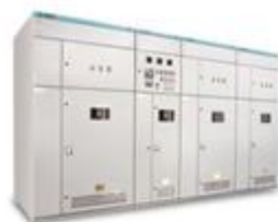
MSC型高压自动式投切无功补偿装置

电力电子产品是运用高频开关功率半导体对电力进行控制，并对电压及电流的品质进行调节。如今提高能源利用效率，普及并促进可再生能源的使用，已成为主要工业国家能源政策中必须达成的目标。这种情况下对电能而言电力电子设备市场空间巨大。公司电力电子产品主要应用于电网电力系统、地铁城铁电力贯通线及牵引变电站、城市二级变电站、风力光伏电站及其它重工业负荷。