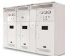
TSC型动态无功功率补偿装置