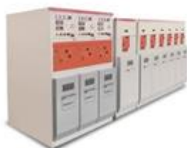
AIR-12环保气体绝缘开关环网柜