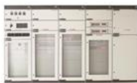
电力用直流和交流一体化电源