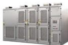
SVG高压动态无功补偿装置