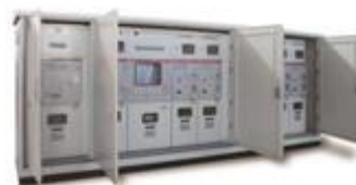
C25C中试开闭站/带开关电缆分支箱